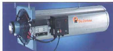
Рис. 1. «Джет Мастер» GP 70

Тепловой генератор «Джет Мастер» поставляется для эксплуатации на природном или сжиженном газе, имеет 100%-ную теплоотдачу (рис. 1).