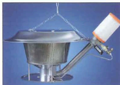
Рис. 4. Газовый излучатель G12