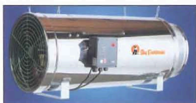
Рис. 2. «Джет Мастер» Р 100 для обогрева жидким топливом

Теплогенератор «Джет Мастер» может работать и на дизельном топ-