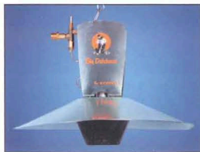
Рис. 5. Газовый излучатель SOL 11600

ливе (рис. 2). Его характеристики приведены в таблице 2.